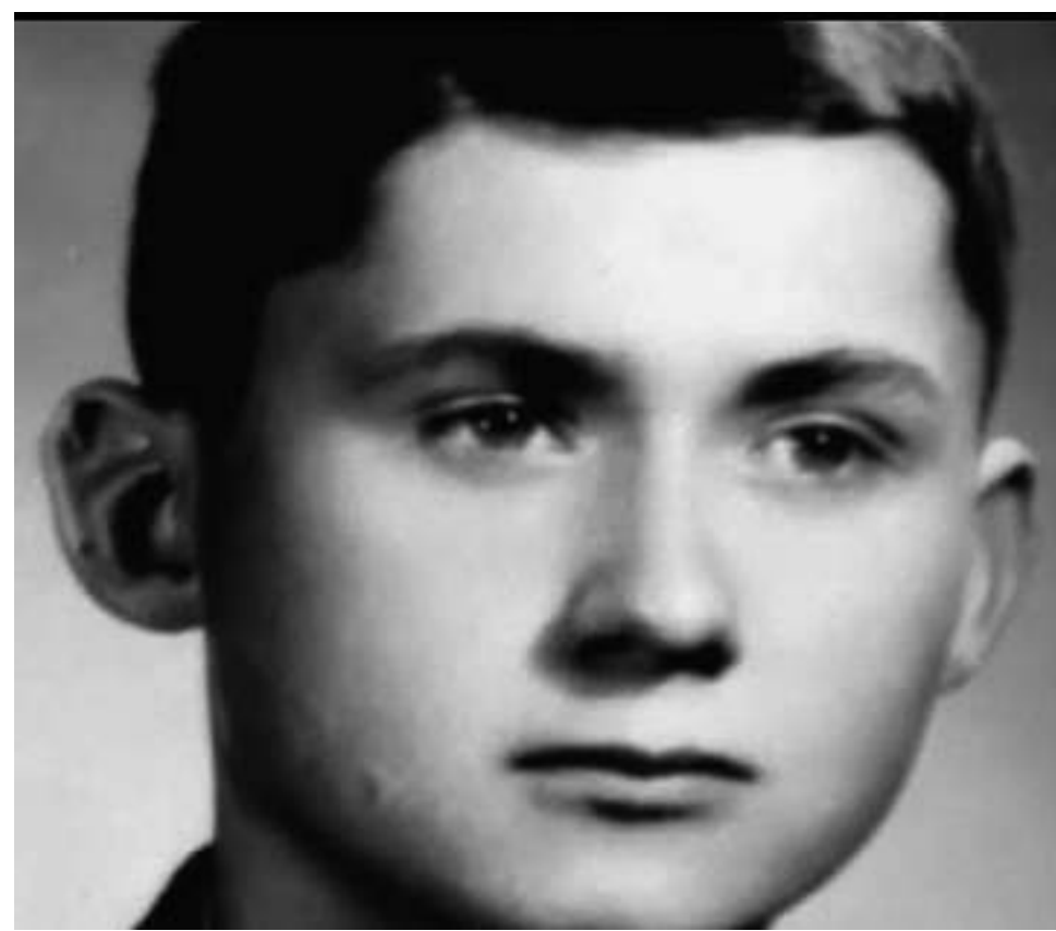
Der polnische Serienmörder Karol Kot (*1946, †1968).